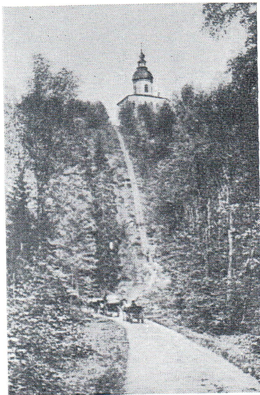
Спaso-Вознесенскій Скитъ на Сѣкирной горѣ.

произвола и невѣжества. Есть еще рота канцеляристовъ, обслуживающихъ учрежденія управленія. Вообще весь лагерь раздѣленъ на рабочія роты со своими ротными командирами и писарями. Роты достигали двухсотъ-трехсотъ человѣкъ. Кремлевскій районъ вмѣщалъ къ концу моего срока до 4-хъ тысячъ человѣкъ, а всѣ Соло-