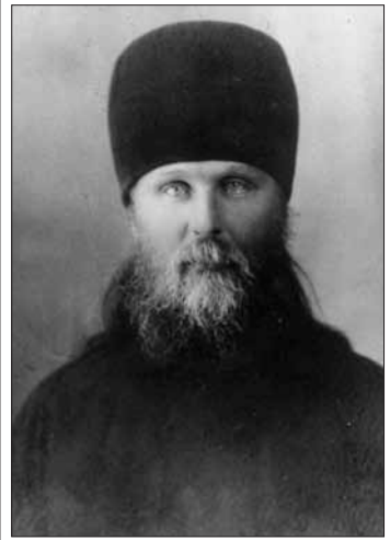
Архиепископ Иларион. Соловецкий концлагерь. 1929 год

Подходил к концу очередной срок заключения. В конце лета и осенью 1929 года владыка писал родственнице: «Живу я все по-прежнему, вполне благополучно, без нужды и горя. Никуда я не трогаюсь с места. Вот уже два года, как живу в одном и том же доме, среди леса, между морским заливом и озером... Про свое ближайшее будущее ничего, конечно, не знаю. Хоть ничего хорошего не жду. Вот сейчас я не чувствую себя переутомленным, потому что здесь мне