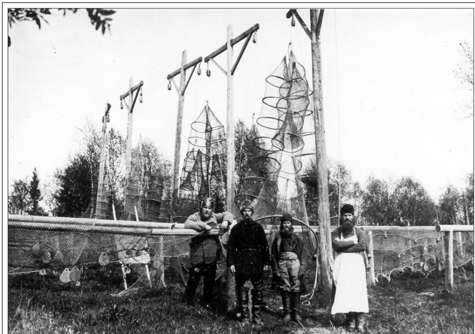
Соловецкий концлагерь. Архиепископ Иларион (крайний слева)

Призывая Бога во свидетели, своею архиерейской совестью удостоверяю, что заявление бывшего архиепископа Евдокима есть бессовестная заведомая ложь — никакого прошения никому я не подавал и самозванного синода их никогда не признавал и не признаю, ибо, сохраняя верность своему архиерейскому обещанию, пребываю в полном послушании единого законного первосвященника Российской Православной Церкви Святейшего Патриарха Тихона.