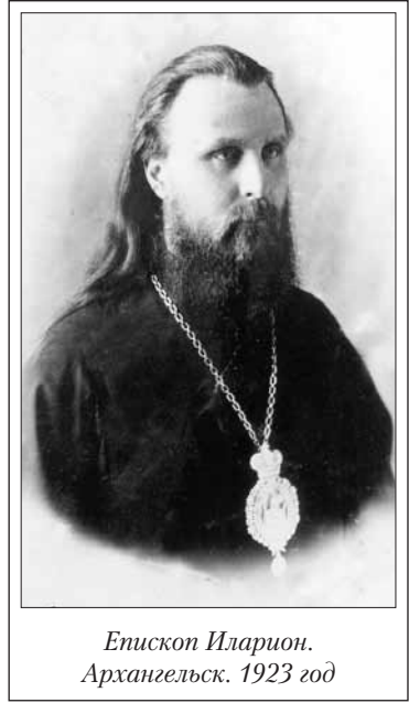
Епископ Иларион. Архангельск. 1923 год

Епископ Иларион в это время получал много писем, часть из них приходила с оказией, часть по почте. Обширная переписка послужила причиной того, что ГПУ решило арестовать владыку и произвести у него обыск. Прочитав ордер на обыск и арест, епископ спросил: «Что же, вы арестуете меня независимо от результатов обыска?» Получив утвердительный ответ, владыка остался совершенно спокоен. Увидев, что сотрудник ГПУ откладывает письма, епископ заметил, что напрасно он это делает, потому что все они прошли через ГПУ и просмотрены; вот и на днях он получил очень неаккуратно заклеенное письмо, что ясно свидетельствует о том, что его в ГПУ уже прочитали. Пришедший во время обыска митрополит Серафим (Чичагов), также находившийся в ссылке, заметил, что это, вероятно, какое-то недоразумение, которое