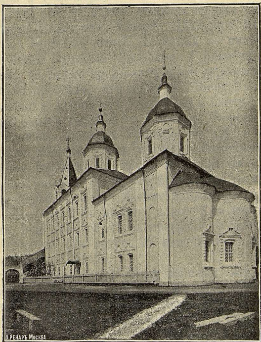
Церковь Свв. Ап. Петра и Павла. въ губ. гор. Смоленскъ.