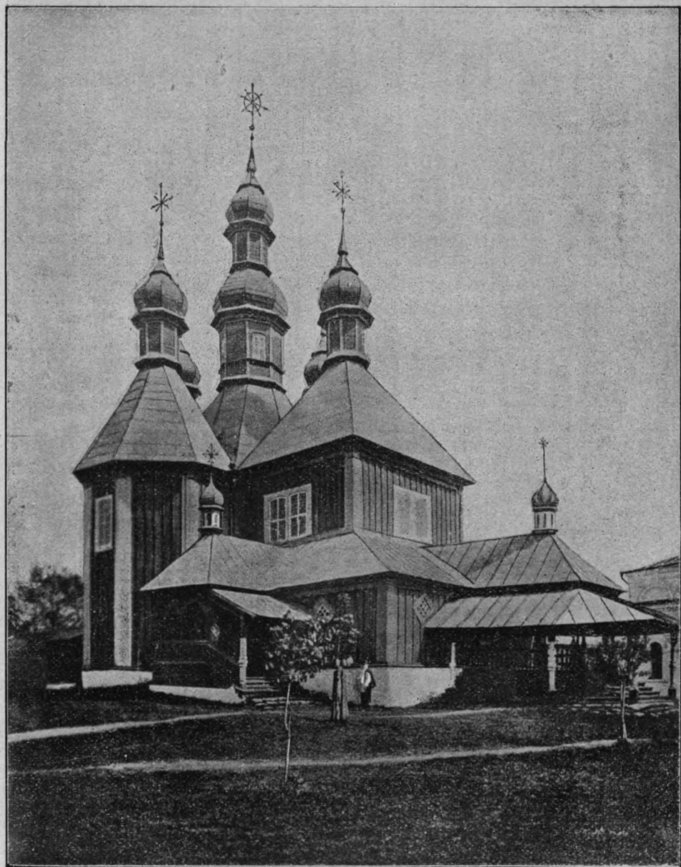
Св.-Троицкая церковь съ сѣверо-западной стороны.