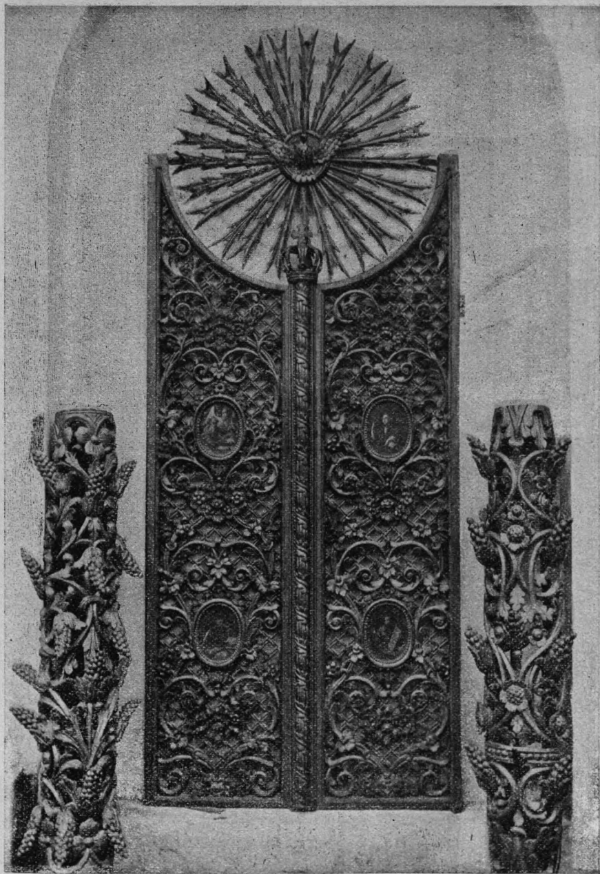
Св.-Климская церковь. Царскія врата и колонки отъ иконостаса.