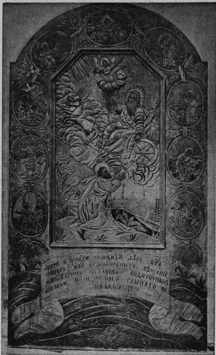
Укона св. пророка Ішії.