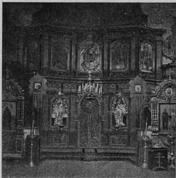
Иконостасъ въ Ильинской церкви.