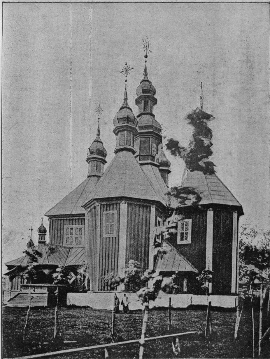
Св.-Нлимнская церковь съ восточной стороны.