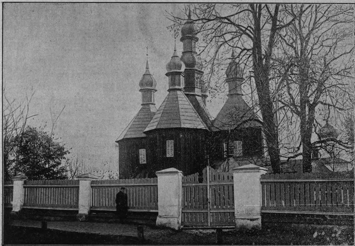
Св.-Климентская церковь съ сѣверной стороны.