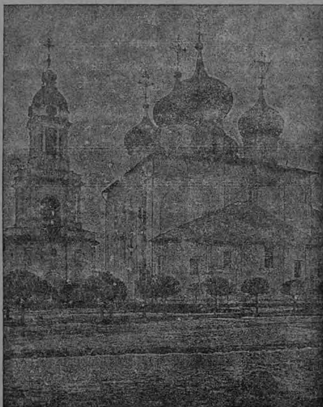
ТВЕРСКОЙ КРАСДРИВНЫЙ СОБОРЪ.