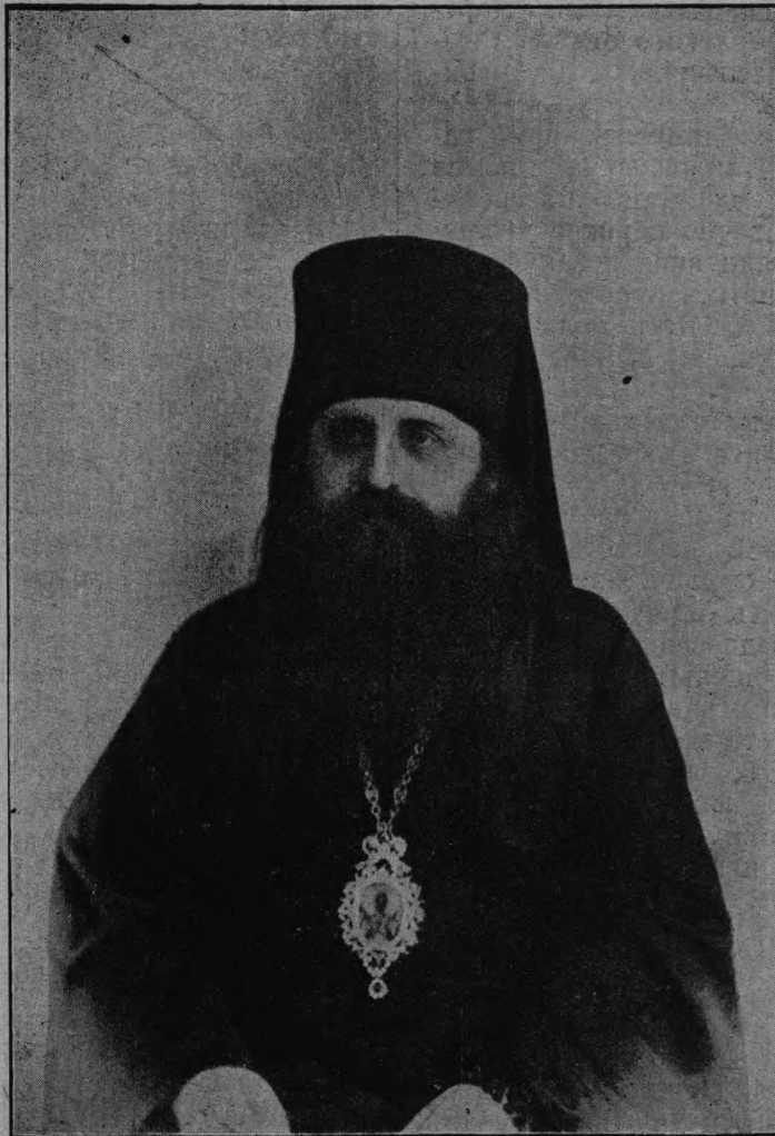
Высокопреосвященнѣйшій Антоній, Архіепископъ Волынской и Житомирской.

Государственной Думѣ, чрезъ своихъ тринадцать представителей, близкихъ и дружественныхъ Почаевскому Союзу, вновь добилась сегодня великаго счастья предстать предъ Ваши свѣтлыя царскія очи въ числѣ 28 человекъ, а именно—полнаго