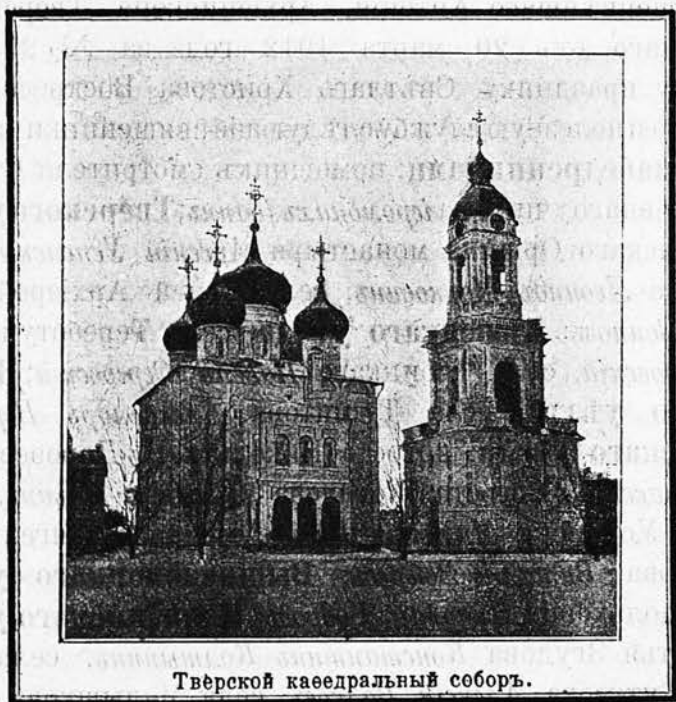
Тверской кафедральный соборъ.