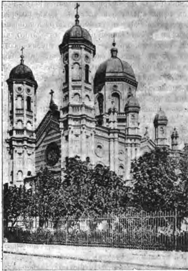
Церковь святаго Спиридона Новаго въ гор. Букурештахъ.