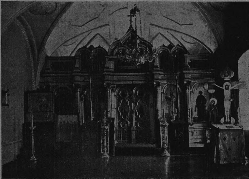
Внутренній видъ церкви Виленскаго женскаго училища.