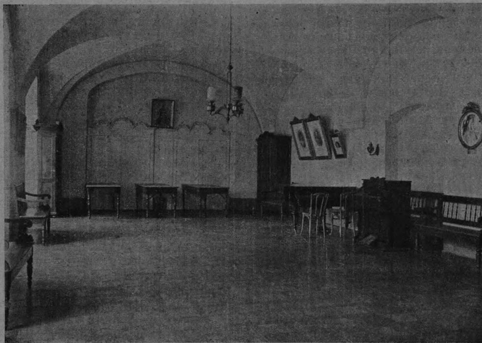
Залъ Виленскаго женскаго училища

Радость отъ посѣщенія Царской Семьи училища возобновилась и усилилась еще отъ того, что Государыня Императрица, осчастлививъ учи-