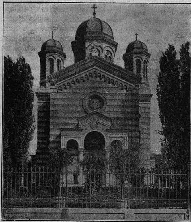
Церковь княжны Балашы въ гор. Букурештахъ.

томъ Валахія Каллиникомъ Миклеску († 1886 г.) освящена была величественная и богатѣйшая церковь «княжны Балашы», построенная въ теченіе десяти лѣтъ близъ той церкви, которая построена въ 1711 княжною Балашею; на мѣстѣ алтаря этой церкви теперь воздвигнутъ великолѣпный мраморный памятникъ - крестъ. Въ новой церкви погребена сама основатель-