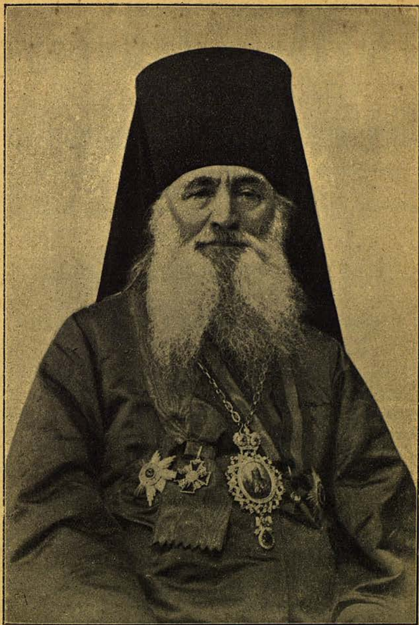
Высокопреосвященный Гурій, Архієпископъ Новгородскій и Старорусскій,

бывшій Предсѣдатель Училищнаго Совѣта при Святѣйшемъ Синодѣ.