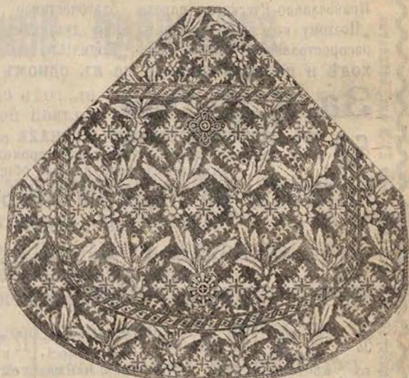
Риза въ рисунокъ № 2055.

Желая оградить заинтересованныхъ лицъ отъ предпримчивости нашихъ подражателей, мы настоящимъ считаемъ долгомъ сообщить, что въ рисунокъ 2055 нами изготовлены ризницы для города Костромы и Костромской Епархіи, предназначенныя къ предстоящимъ Юбилейнымъ торжествамъ 300-лѣтія царствованія Дома Романовыхъ. Означенныя ризницы сданы нами въ городѣ Костромѣ Комиссіи по изготовленію Парадныхъ Церковныхъ облаченій и добросовѣтность исполненія ихъ подтверждена актомъ отъ 26 октября прошлаго 1912 года.