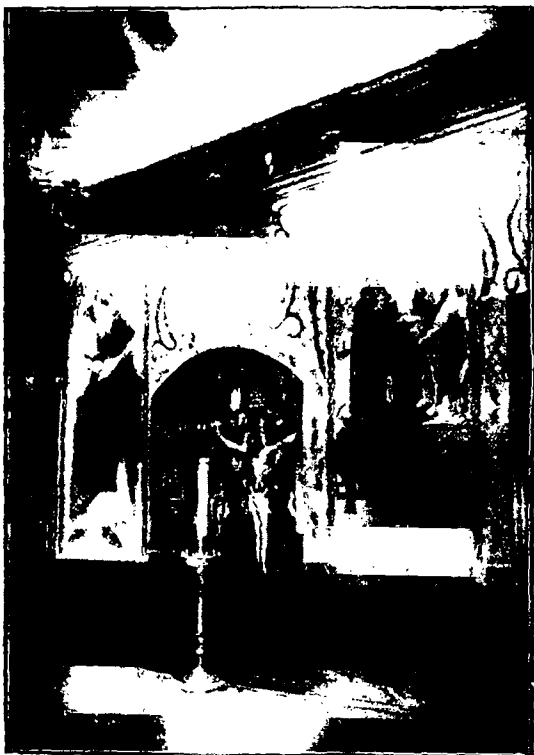
Часть сѣверной стѣны.