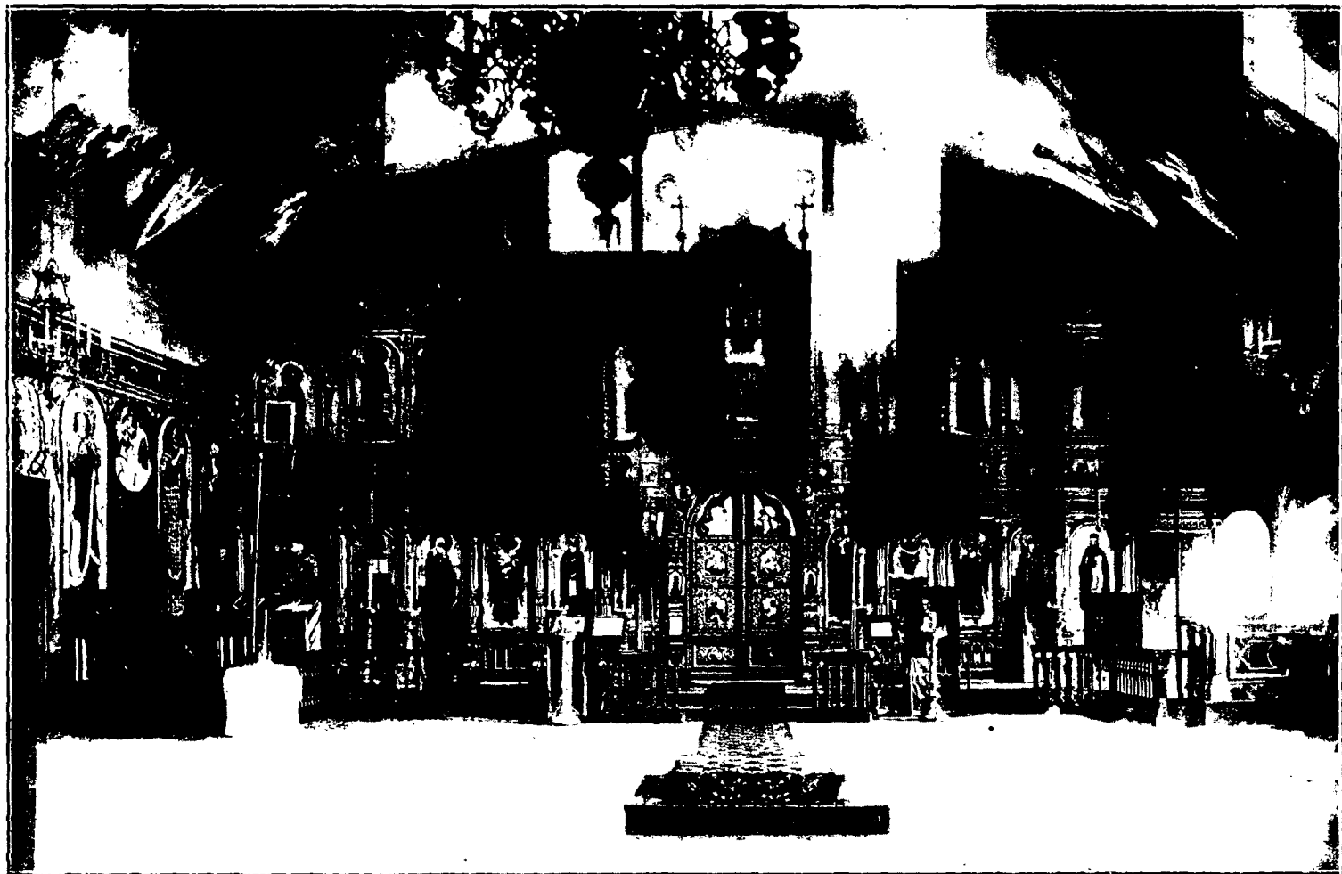
Иконостасъ храма Императорской Московской Духовной Академіи.