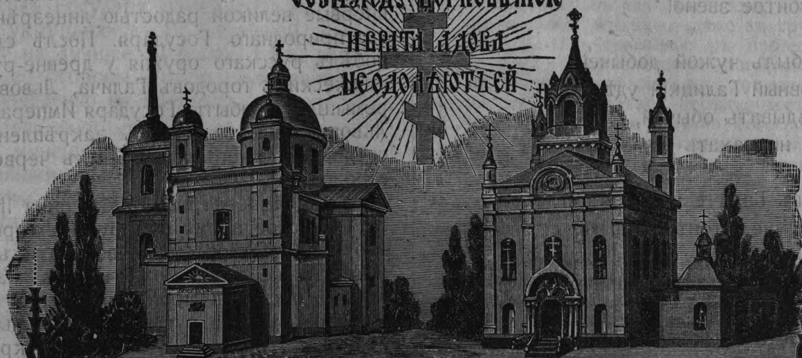
Хр. Св. Духа

Сознание Церковь Мою и веры слова неодолятъ ей