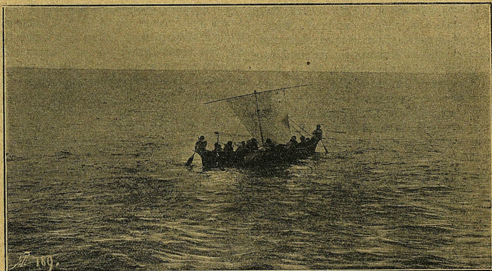
Перевозъ черезъ проливъ на байдаркѣ.

Въ храмѣ народу было уже достаточно, но преимущественно женщины и дѣти; большинство мужчинъ, какъ мнѣ сказали послѣ, было на рыбномъ промыслѣ. Священникъ Рысевъ встрѣтилъ меня въ облаченіи съ крестомъ въ рукахъ и святою