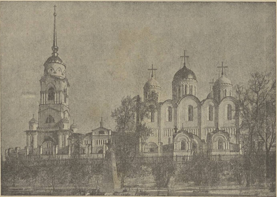
Скоропечатня И. Коиль. 1915 г.