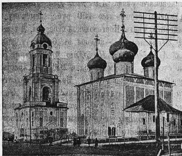
Тверской кафедральный соборъ.