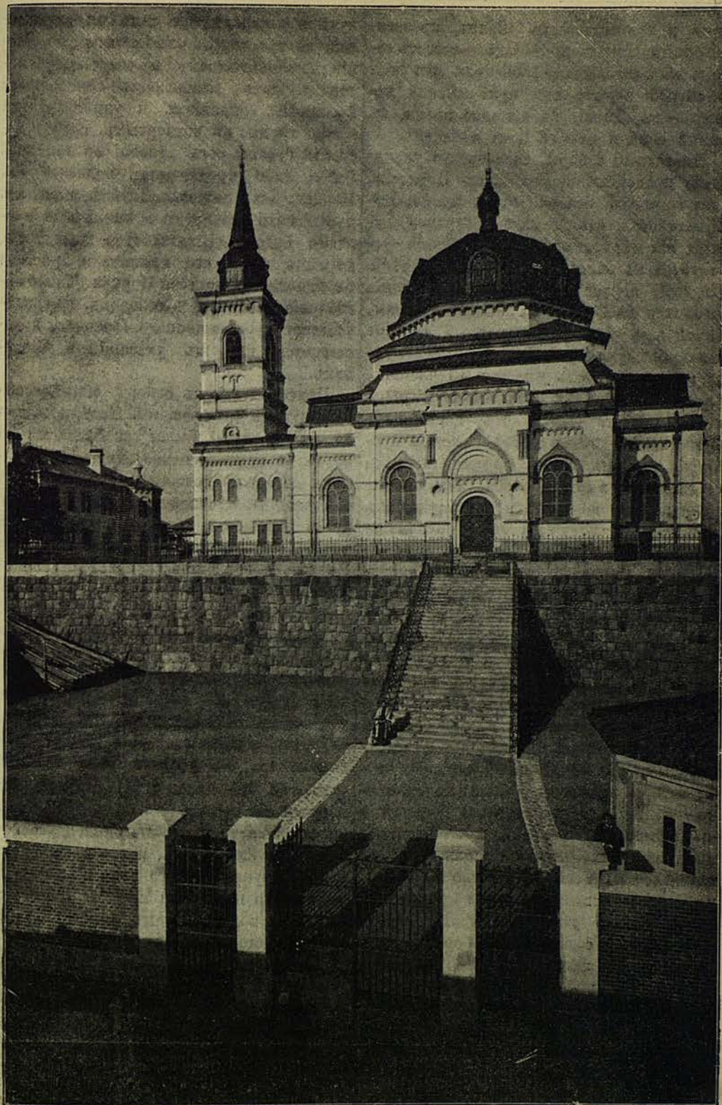
Соборный храмъ Воскресенія Христова при Россійской духовной миссіи въ Токио.