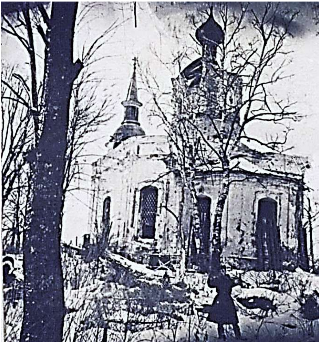
Фото 1944 гг. из фондов Новгородского областного краеведческого музея

Добавил: Михаил Мещанинов Частная коллекция. Фото 1900-х годов