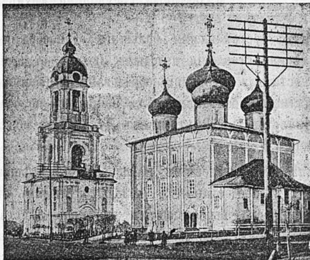
Тверской кафедральный соборъ.