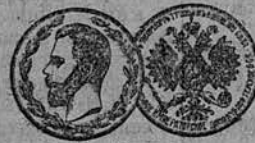
Ростовъ на Дону.