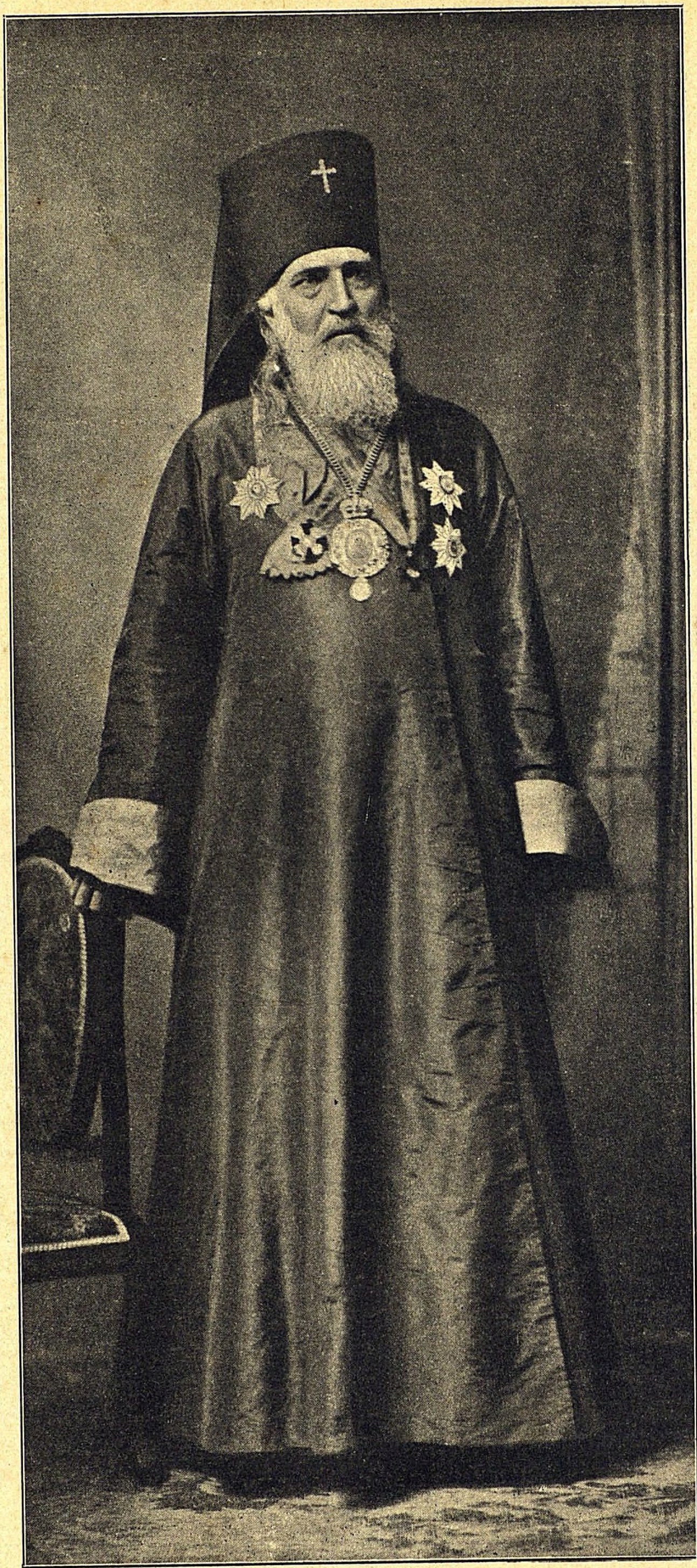
Высокопреосвященный Николай, Архієпископъ Японскій.