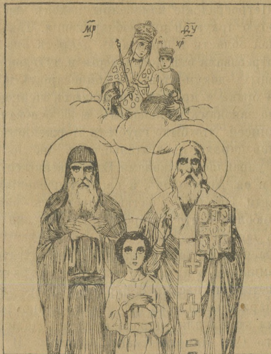
Св. Лаврентій еп. Тур. Св. м. Гавріиль Св. Кирилл. еп. Туров. Слущкій.

Часть официальная.—Письмо Предсѣдателя Православнаго Миссіонерскаго общества.—Опредѣленіе Святейшаго Синода.—Епархіальныя распоряженія.—Вакантныя мѣста.—Вѣдомость.—Отъ редакціи Минск. Епарх. Вѣдомостей