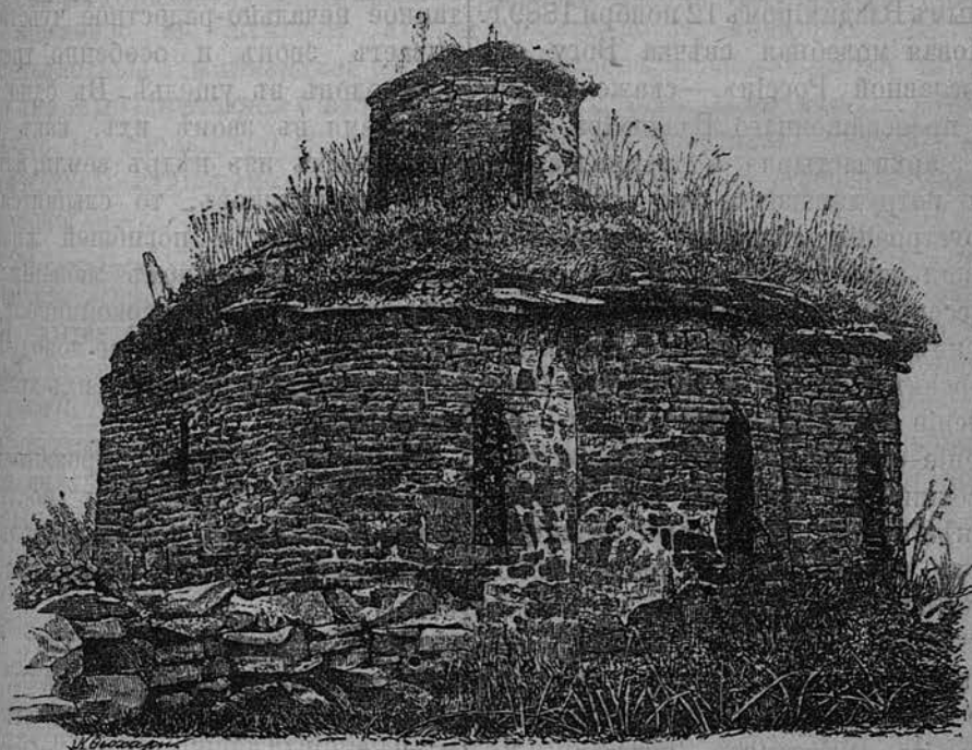
Развалины малаго храма въ Зеленчукской долині.

его по средствамъ и открыли въ немъ богослуженіе на походномъ антиминсѣ для своего духовнаго утѣшенія, посвя- щая свободное отъ трудовъ время устроенію жилыхъ зданій и необходи- мыхъ строеній. Трудолюбивая жизнь инокѣвъ, строгое исполненіе богослу- жебныхъ уставовъ вскорѣ стали из- вѣстны окрестному населенію и упро- чили за поселенцами-иноками добрую славу: обитель чаще и чаще стали