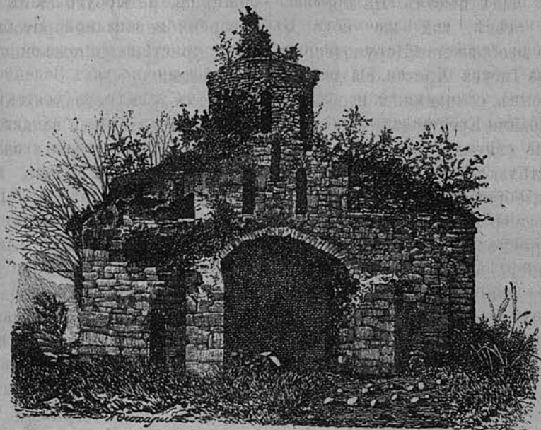
Древне-христіанскій храмъ—при въѣздѣ въ Зеленчукскую долину.

Въ двухъ храмахъ сохранились, хотя и сильно поврежденные, остатки фресковой живописи. Въ одномъ изъ сохранившихся изображеній ликъ чистый и молодой, безъ бороды и усовъ; на головѣ покровъ въ родѣ женскаго, изъподъ него выступаетъ на чело локонъ черныхъ волосъ; платье длинное, правая рука опущена до пояса, и пальцы ея раздвинуты какъ бы для благословенія.