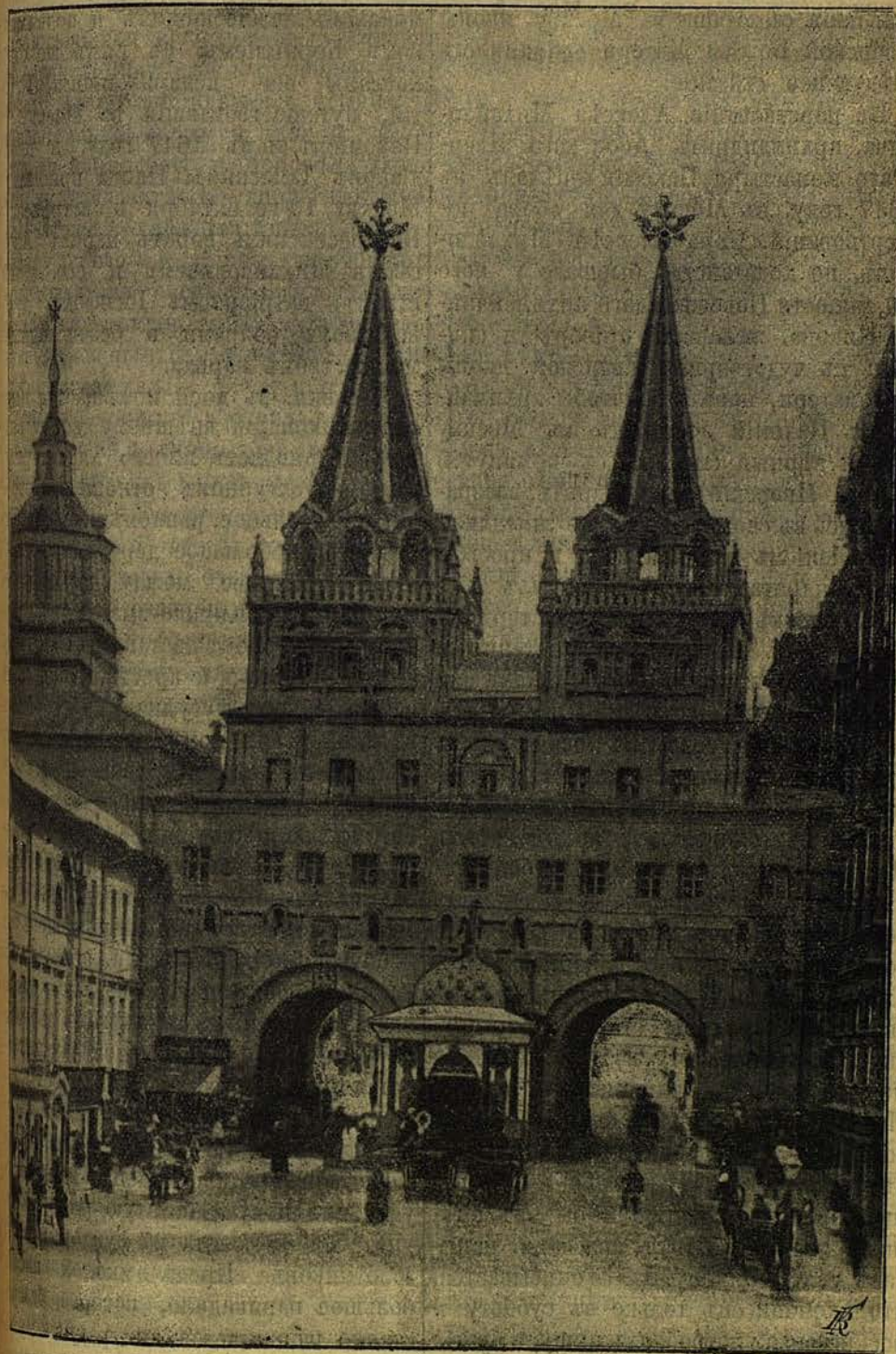
Воскресенскія ворота въ Москвѣ.