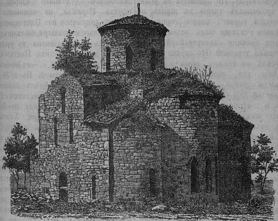
Средній древне-христіанскій храмъ въ Зеленчукской долині.

горы инокъ Благовѣщенской келліи, Хиландарскаго монастыря, іеромонахъ Серафимъ (настоятель келліи) и отъ имени 11 человекъ братіи своей келліи заявилъ, что еще на Аеонѣ онъ слышалъ о существованіи на Кавказѣ древнихъ храмовъ; нынѣ, лично осмотрѣвъ ихъ на берегахъ Большого Зеленчука и рѣки Кубани, онъ рѣшился посвятить свои труды и всѣ средства,