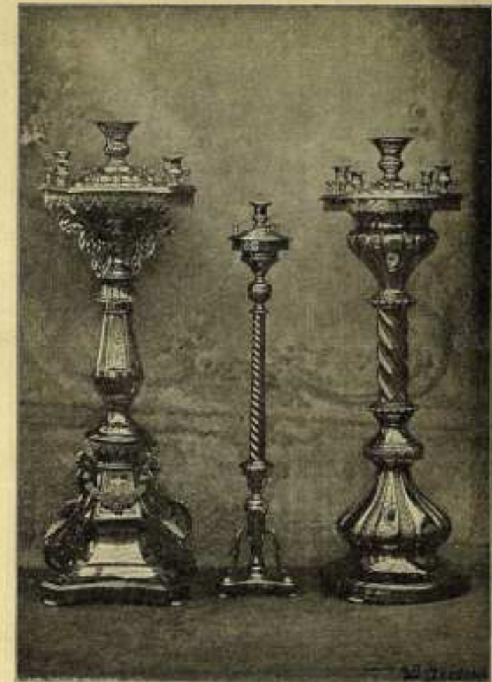
№№ 10—15. № 5. №№ 10—15.