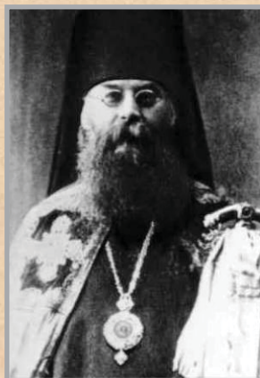
Епископ Макарий (Гневушев).