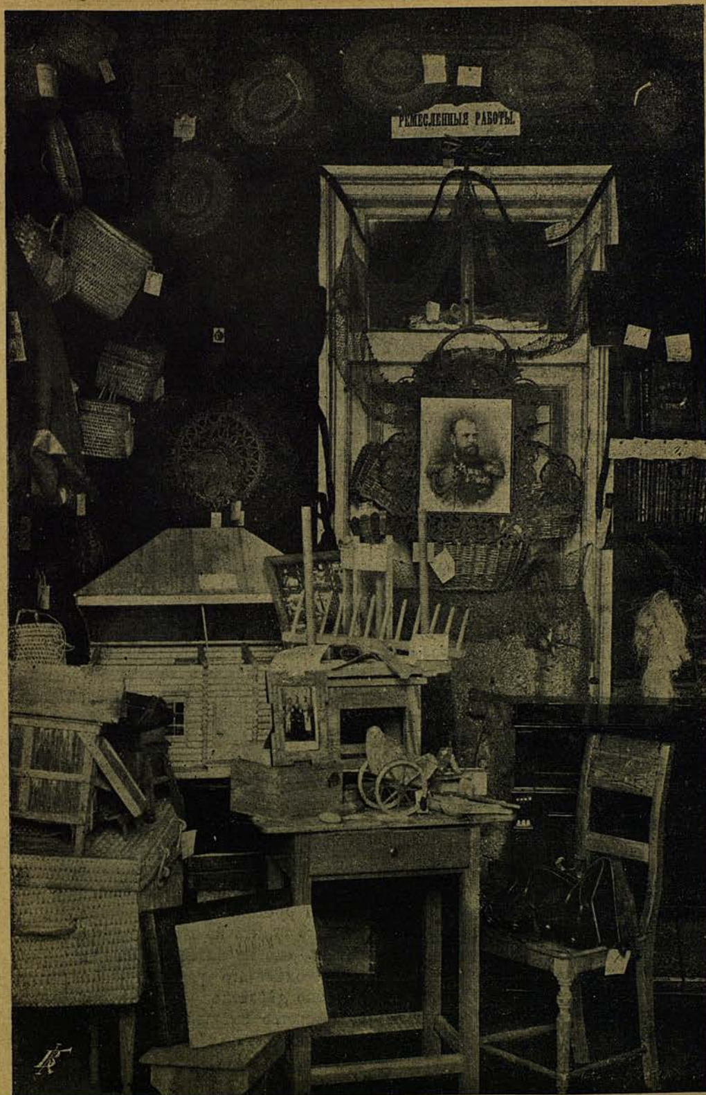
Ремесленные работы церковныхъ школъ.