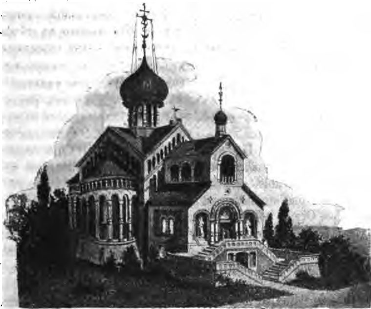
Православный русскій храмъ въ Мариенбадѣ.

И какъ нѣкогда скорбѣлъ Царь и Пророкъ Давидъ, обитая въ домѣ кедровомъ, когда ковчегъ завѣта стоялъ лишь въ убогой кожаной скиніи, такъ скорбѣли душой и прибывавшіе сюда изъ своей страны, изобилующей прекрасными храмами Всевышнему, наши соотечественники; скорбѣли, не видя