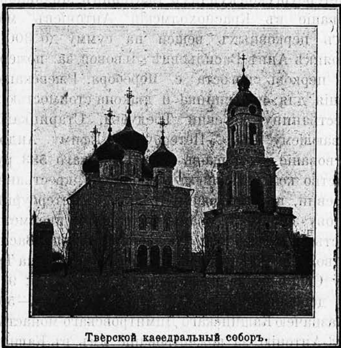
Тверской кафедральный соборъ.