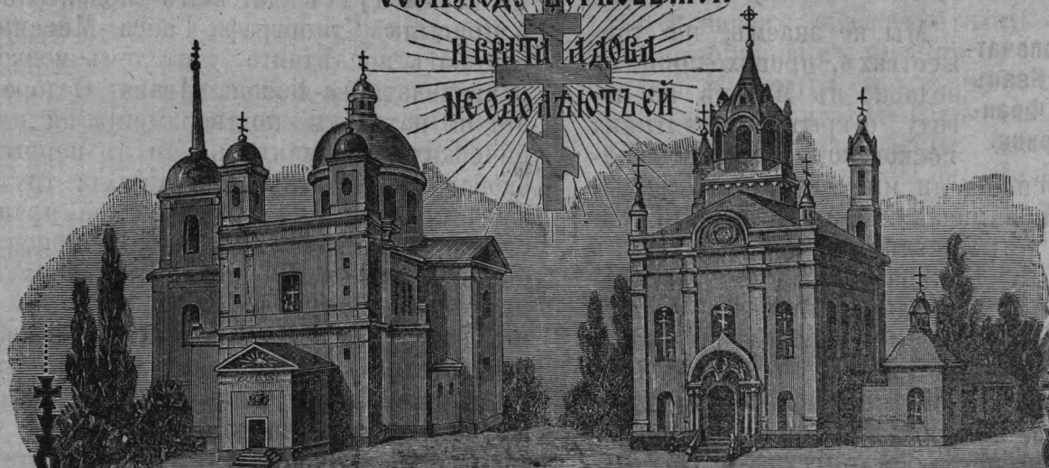
Хр. Св. Духа.

СОЗДАЮЩАЯ ЦЕРКОВЬ МОЮ И БРАТА АДОБА НЕ ОДОЛЖУТЬСЯ