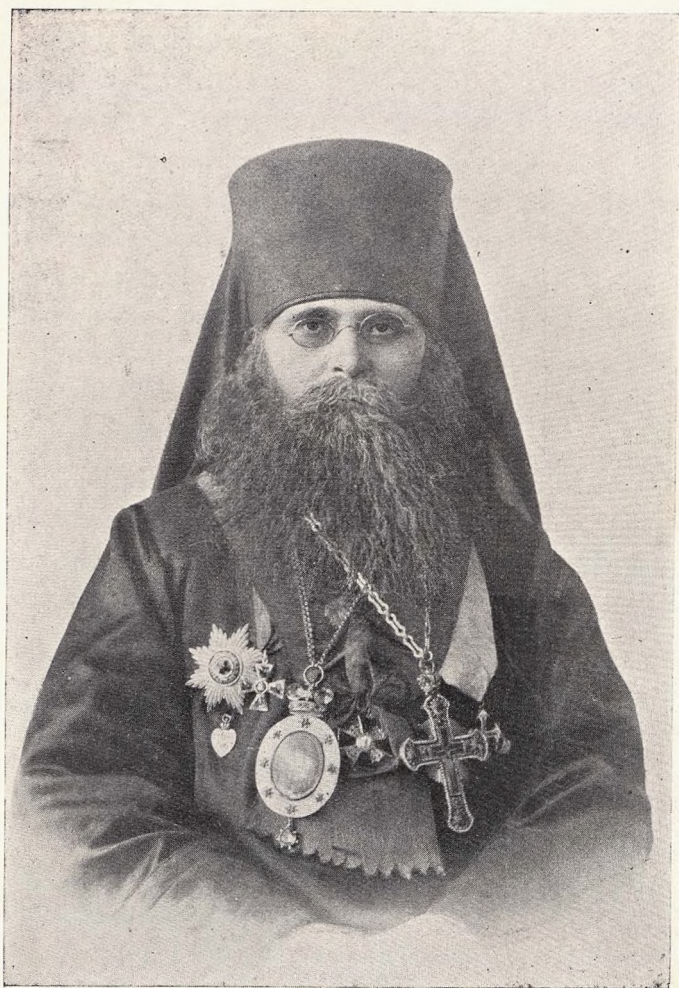
† Высокопреосвященнѣйшій Стефанъ, Архієпископъ Курскій и Обоянскій.