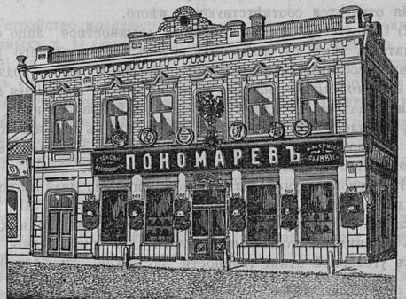
Самара, Дворянская ул. д. Лютеранской церкви.

Фирма за свои работы удостоена высшихъ наградъ въ С.-Петербургѣ и Парижѣ.