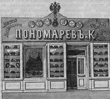
Саратовъ, Никольск. ул. д. Лютеранской церкви.

Принимаются ЗАКАЗЫ на Камилавки и Скуфьи.