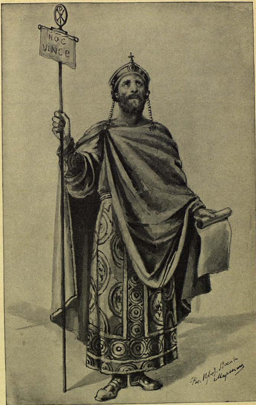
Святыи равноапостольный царь Константинъ Великий.