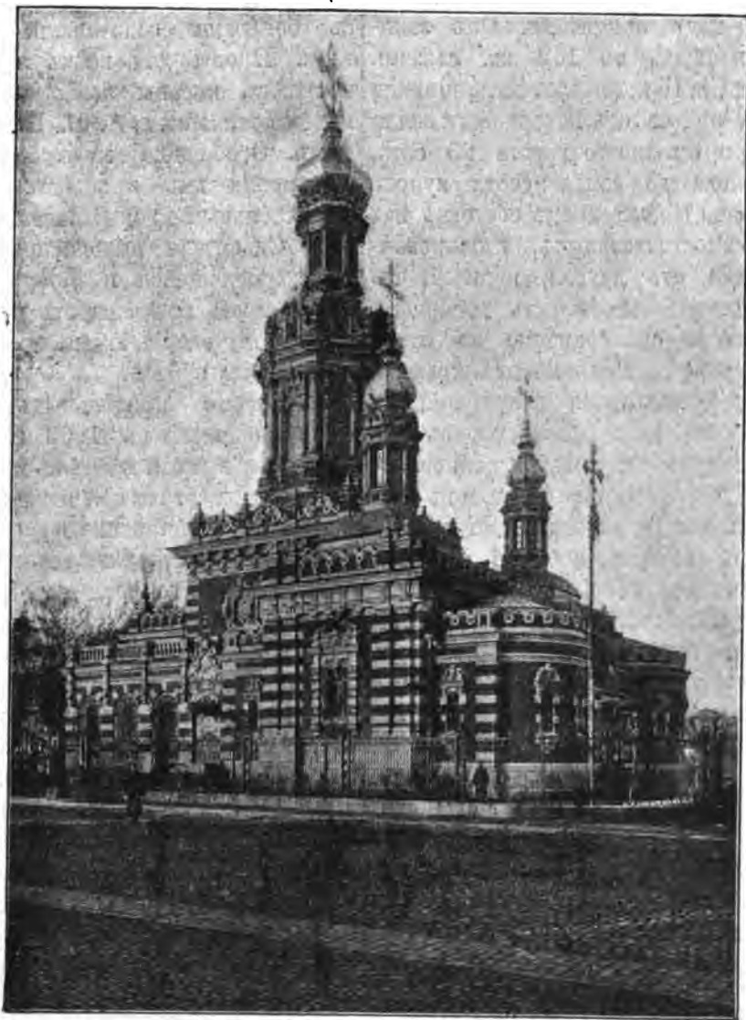
Храмъ Воскресенія Христова на Смоленскомъ кладбищѣ.

занились изученіемъ русскаго стиля до XVII столѣтія включительно, и сначала робкія и неумѣлыя попытки сдѣлать что-либо серьезное въ этомъ направленіи привели къ всестороннему