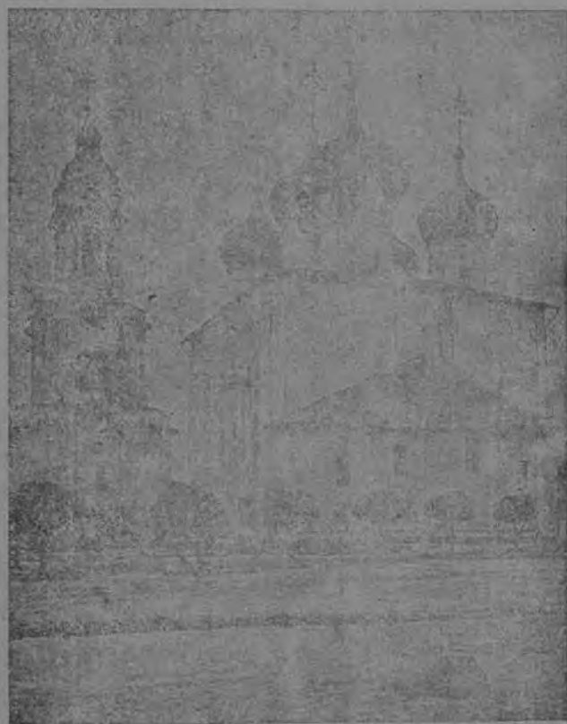
ТВЕРСКОЙ КИЛЮДРИМЫЙ СОБОРЪ