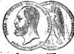
Стокгольмъ 1897 г.