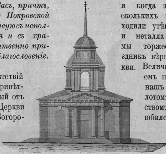
Покровская Церковь съ западной стороны въ первоначальномъ видѣ.

Отъ имени сослужителей своихъ, старосты и представителей прихода позвольте принести отъ всей души нашу глубочайшую признательность и почитательнѣйшую благодарность всѣмъ—жертвователямъ за ихъ щедрыя жертвы на благолѣпіе Дома Царицы Небесной, братіи-сослужителямъ—за ихъ молитвенное участіе въ нашемъ приходскомъ торжествѣ, прихожанамъ храма и молившимся въ немъ—за ихъ любовь