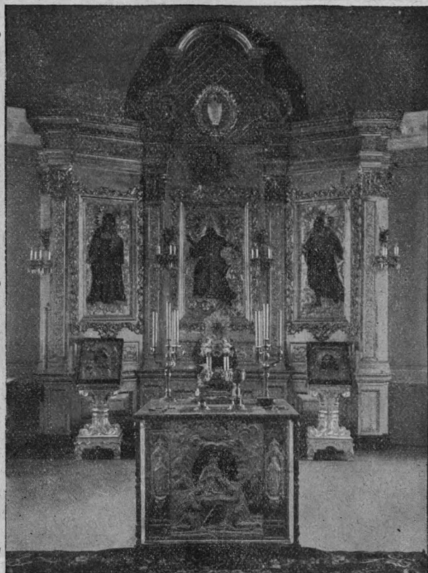
Внутренній видъ средняго алтаря Покровской Церкви.