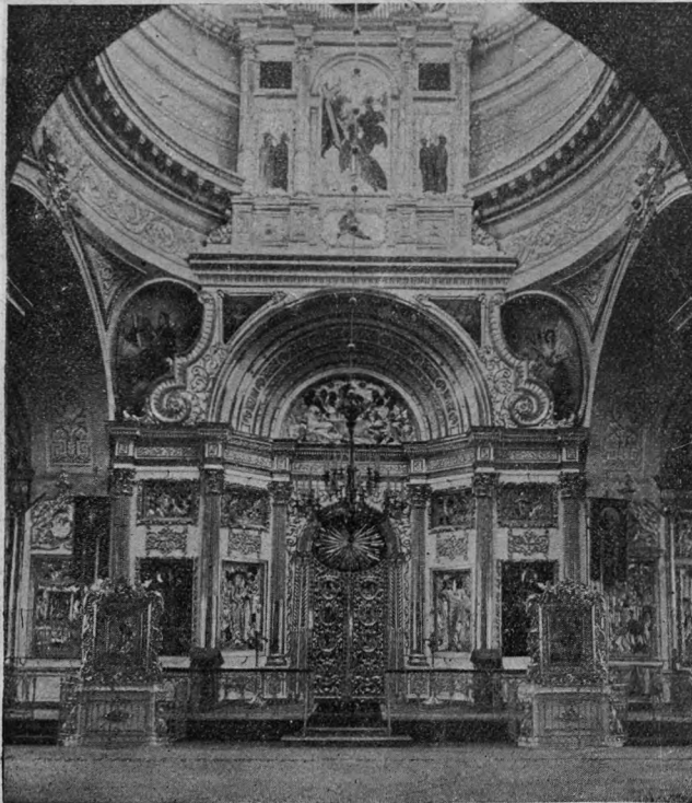
Средній иконостасъ Покровской Церкви въ современномъ видѣ.

Какъ ни велика была готовность жертвовать, какъ ни усердна заботливость о воздвигаемомъ храмѣ, все-таки сооруженіе его, наружное и внутреннее устройство требовали столь значительныхъ суммъ (около