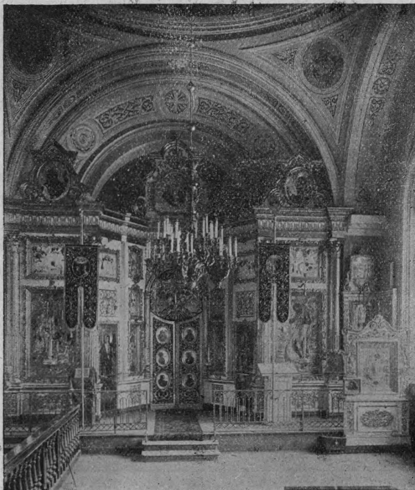
Иконостасъ въ боковыхъ придѣлахъ Покровской Церкви въ современномъ видѣ.

200.000 тысячъ руб. ассигнаціями), что обыватели Коломны не могли собрать ихъ въ короткое время. Потому-то постройка Церкви и затянулась на цѣлыхъ 14 лѣтъ — съ 1798 по 1812 годъ, а считая съ постройкою ограды и часовень даже и на 19 лѣтъ — по 1817 годъ.