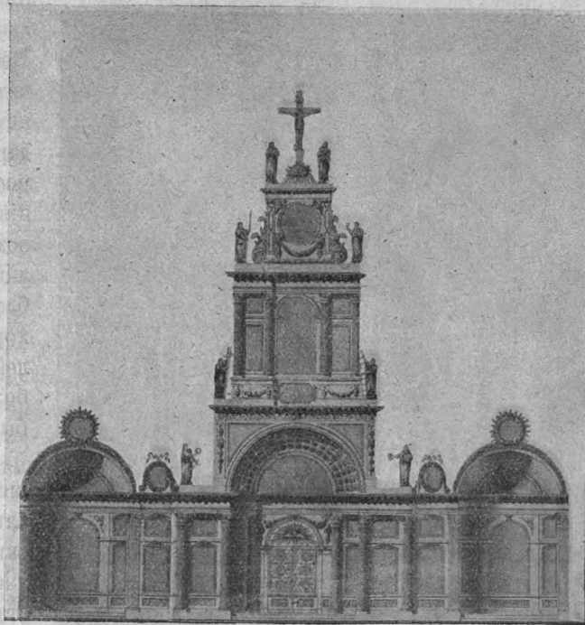
Средній иконостасъ Покровской Церкви въ первоначальномъ видѣ.

Они жертвовали не отъ богатства, а отъ скудости. Большинство изъ нихъ были люди бѣдные, тяжелымъ трудомъ зарабатывавшіе себѣ хлѣбъ насущный.