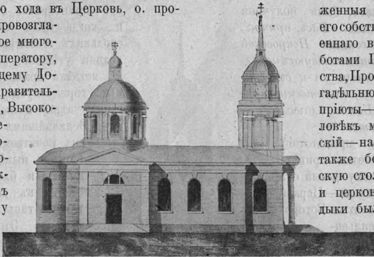
Покровская церковь съ сѣверной стороны въ первоначальномъ видѣ.