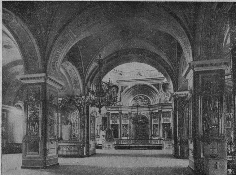
Внутренній видъ Покровской Церкви въ современномъ видѣ.

Ходатайство жителей Коломны было уважено, и планъ Церкви разсмотрѣнъ и утвержденъ Императоромъ Павломъ Петровичемъ 3 іюня 1798 года.