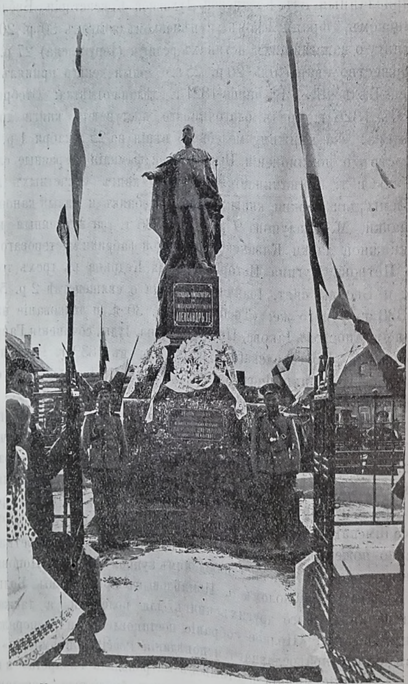
Памятникъ Императору Александру II-му въ с. Алатахъ, Казанскаго уѣзда.

Предъ входомъ во храмъ «любовію населенія Алатской, Атинской и Менгерской волостей въ память освобожденія крестьянъ и 300-лѣтія царствованія Дома Романовыхъ поставленъ 14 мая 1914 года» и открытъ 25 мая памятникъ Царю-Освободителю.