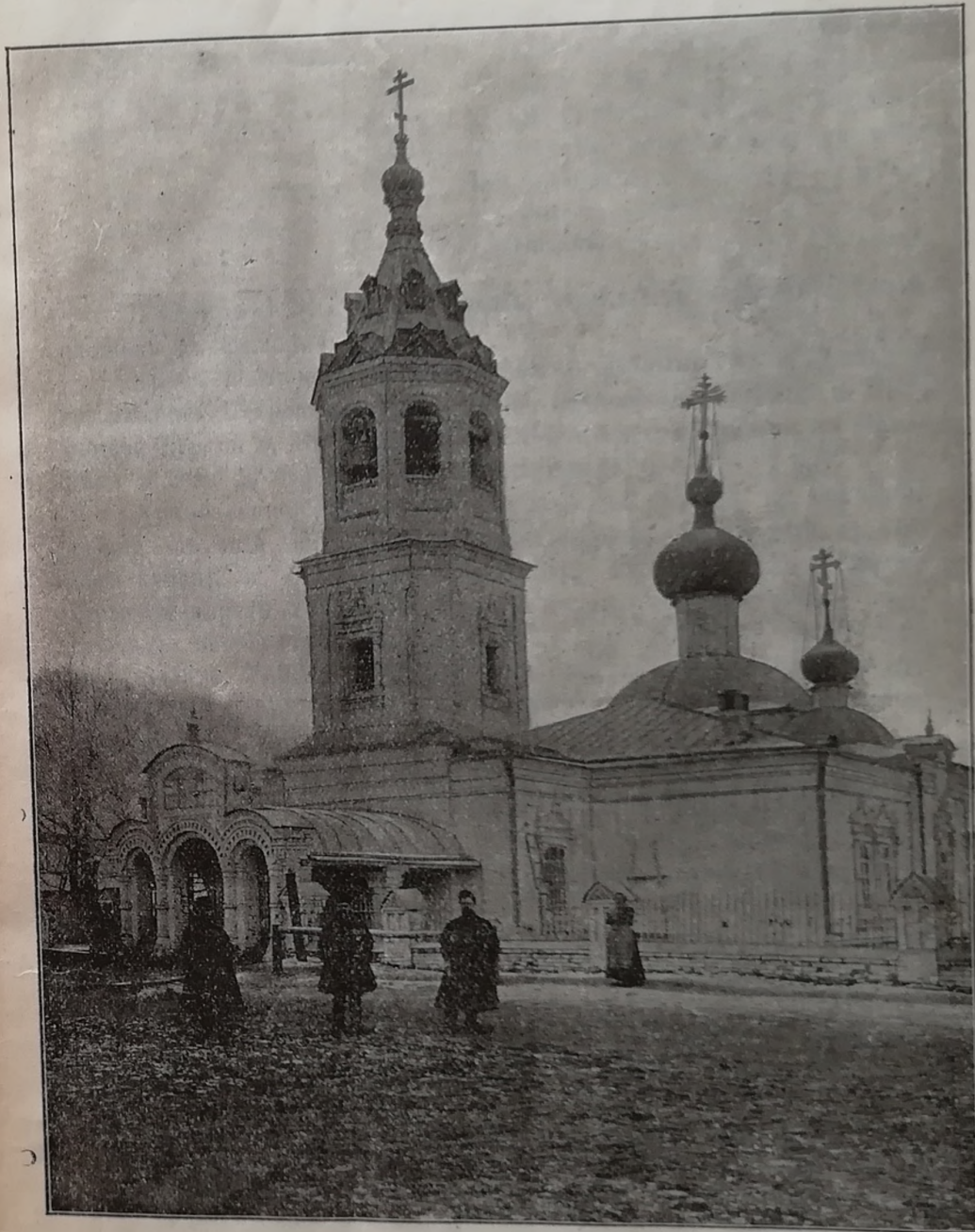
Храмъ села Алаты.