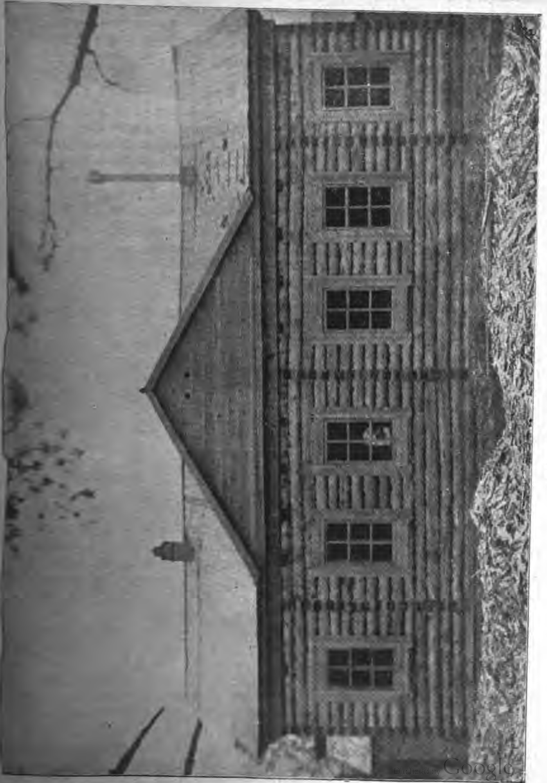
Баракъ въ колоніи проказенныхъ.