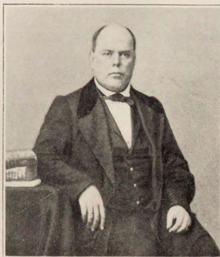
Проф. Сергій Константиновичъ Смирновъ .