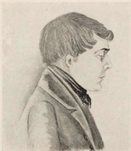
Проф. церковной истории Александръ Васильевичъ Горскій въ 1843—1844 гг. (Срисоваль на лекціяхъ Д. И. Кастальскій).