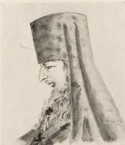
Ректоръ Моск. Дух. Академіи архимандритъ Филаретъ (Гумилевскій). Съ рисунка Д. И. Кастальскаго.