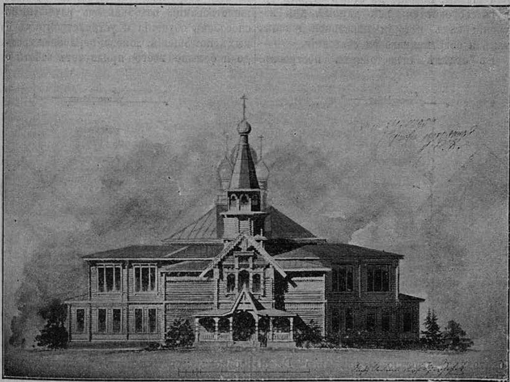
Церковь со школой въ память въ Бозѣ почившаго Императора Александра III.