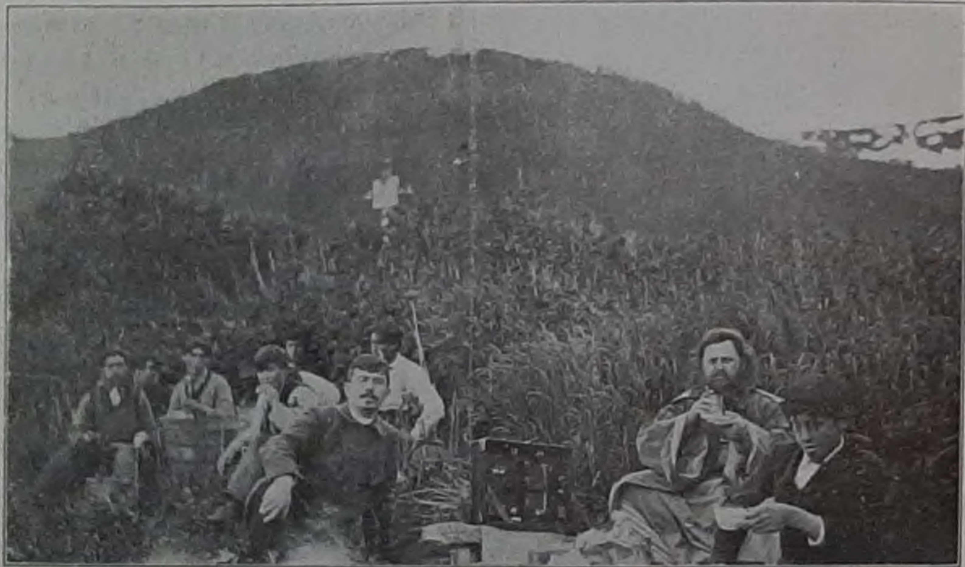
Въ Старой Ситкѣ.

Огонекъ весело потрескивалъ, вода вскипѣла, и мы расположились бивуакомъ завтракать. Подошелъ Барановъ, но безъ ямановъ: тѣ успѣли сберечь жизнь свой за-