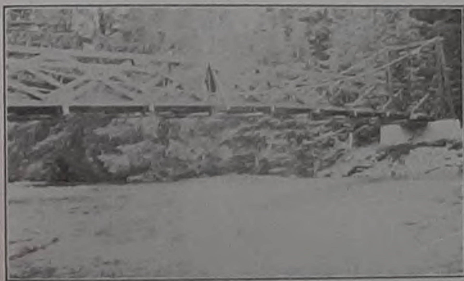
Знаменитый Ситкинский мостъ.

будто каждый напившійся этой воды непременно побываетъ еще разъ въ Ситкѣ, въ этихъ прекрасныхъ мѣстахъ, когда я стремительно зачерпывалъ всей пригоршней свѣжую, чистую воду и пилъ ее безъ конца... Роцца — это правительствомъ учреждаемый и неприкосновенный отнынѣ общественный Ситкинский паркъ. Дѣвственная его прелесть не нарушается ни частыми открытыми полянками, на которыхъ возвышаются племенные