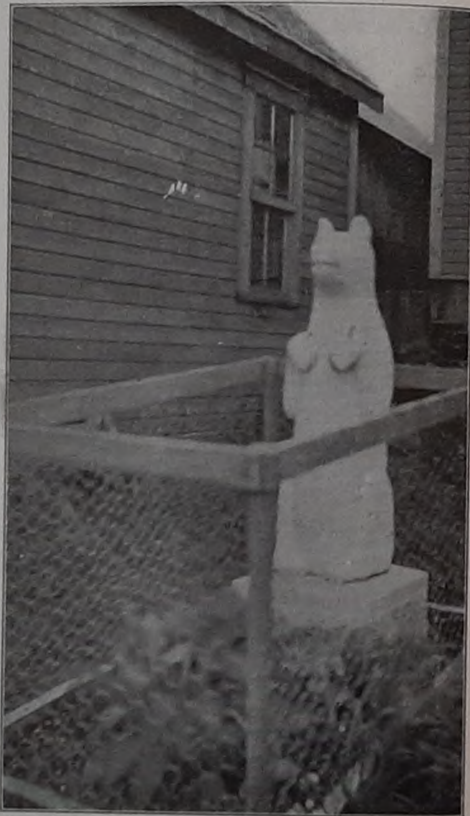
Мраморный медвѣдь въ Ситкѣ на могилѣ колоша.

мраморнаго медвѣдя съ золочеными глазами, зубами и когтями, въ нѣсколько сотъ долларовъ въ Штатахъ заказали и онъ уже въ Ситку плыть. Конечно, свѣще тоже разрѣшенія не послѣдовало. Тогда стали индіане планы дѣлать — тайкомъ на кладбищѣ медвѣдя утвердить, — но не такое мѣсто Ситка, чтобы такія дѣла тайкомъ успѣшно продѣлы-