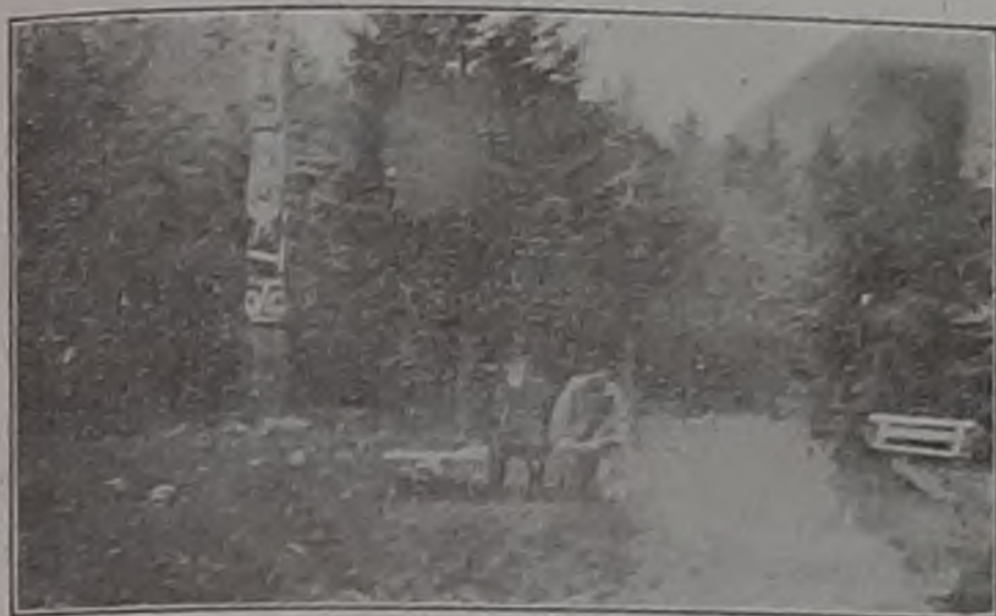
Въ Ситкинскомъ паркѣ.