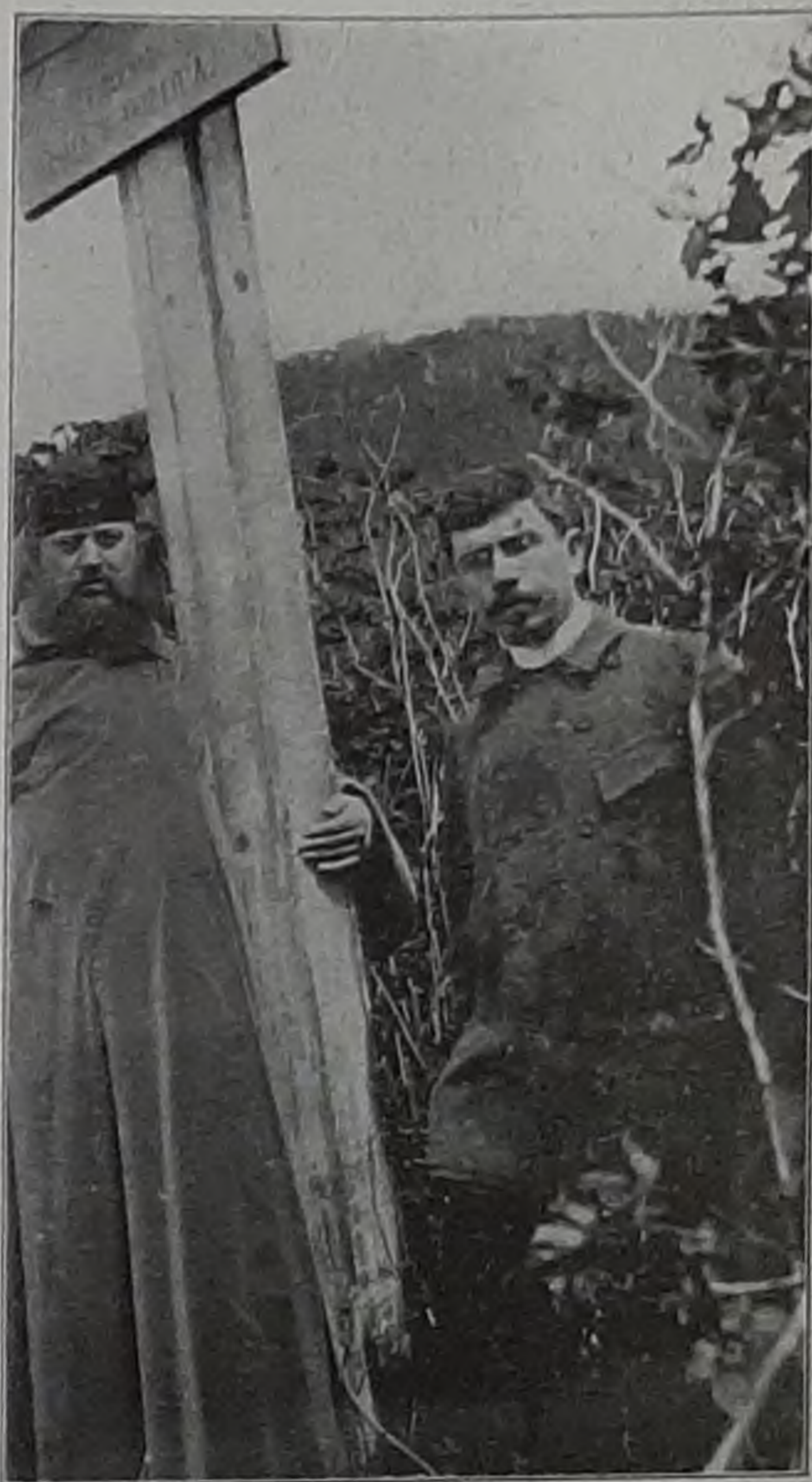
У креста въ Старой Ситкѣ.

Тяжело было однако пробраться къ кресту. Весь пригорокъ густымъ, кустарникомъ поросъ наглухо. Пришлось часть вырубать,