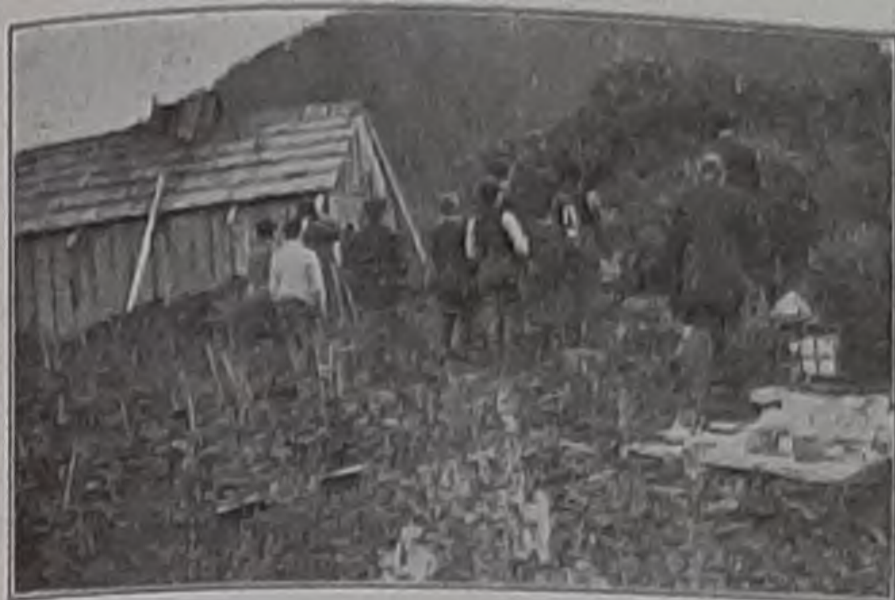
Прощальное .Со Святими упокой- въ Старой Ситкѣ.

что пазывается, и въ усь не дуль: посмѣивался и увѣрялъ, что это сейчасъ пройдетъ, и