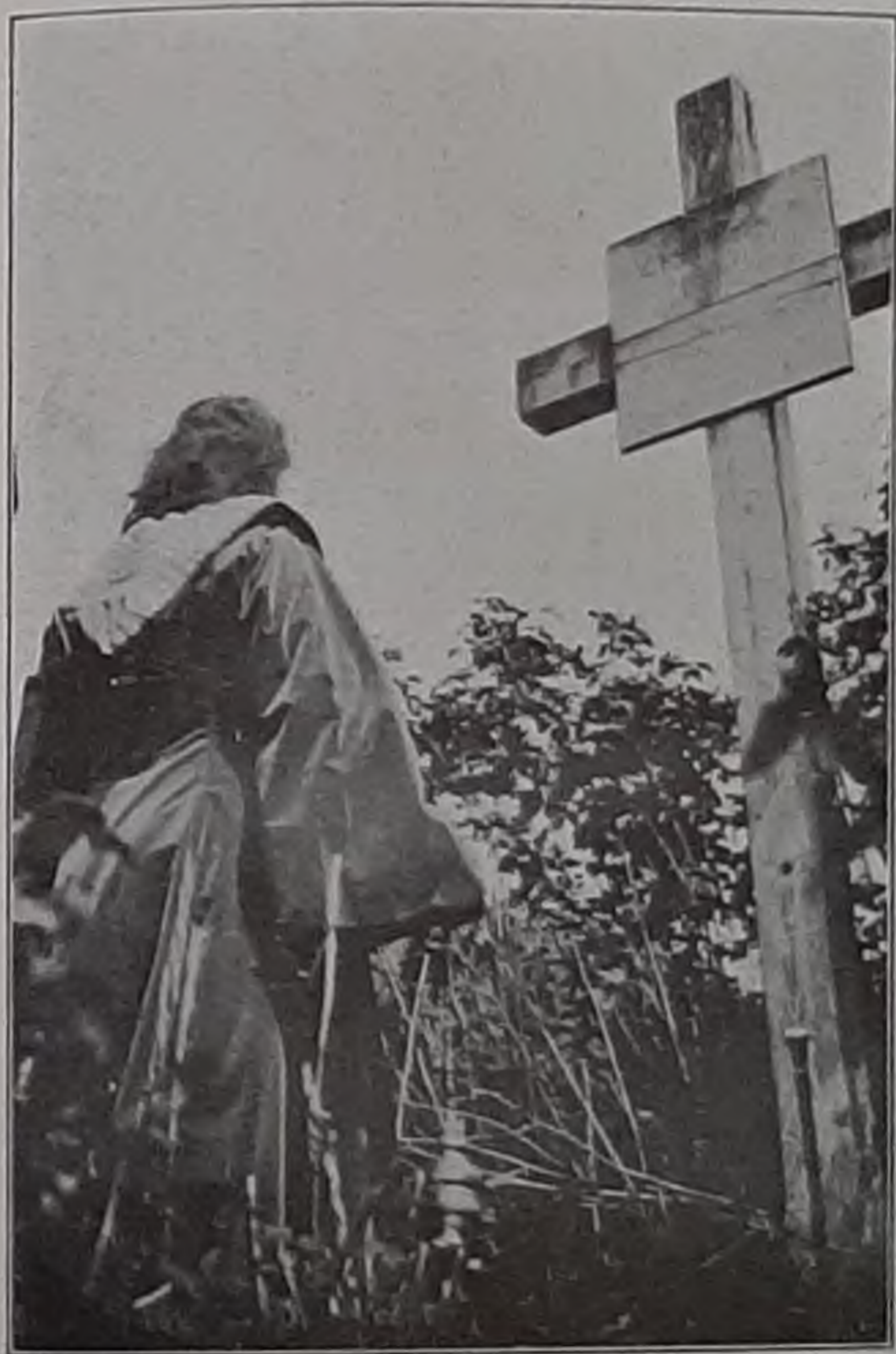
Владыка Архіепископъ совершаетъ литію у креста въ Старой Ситкѣ.