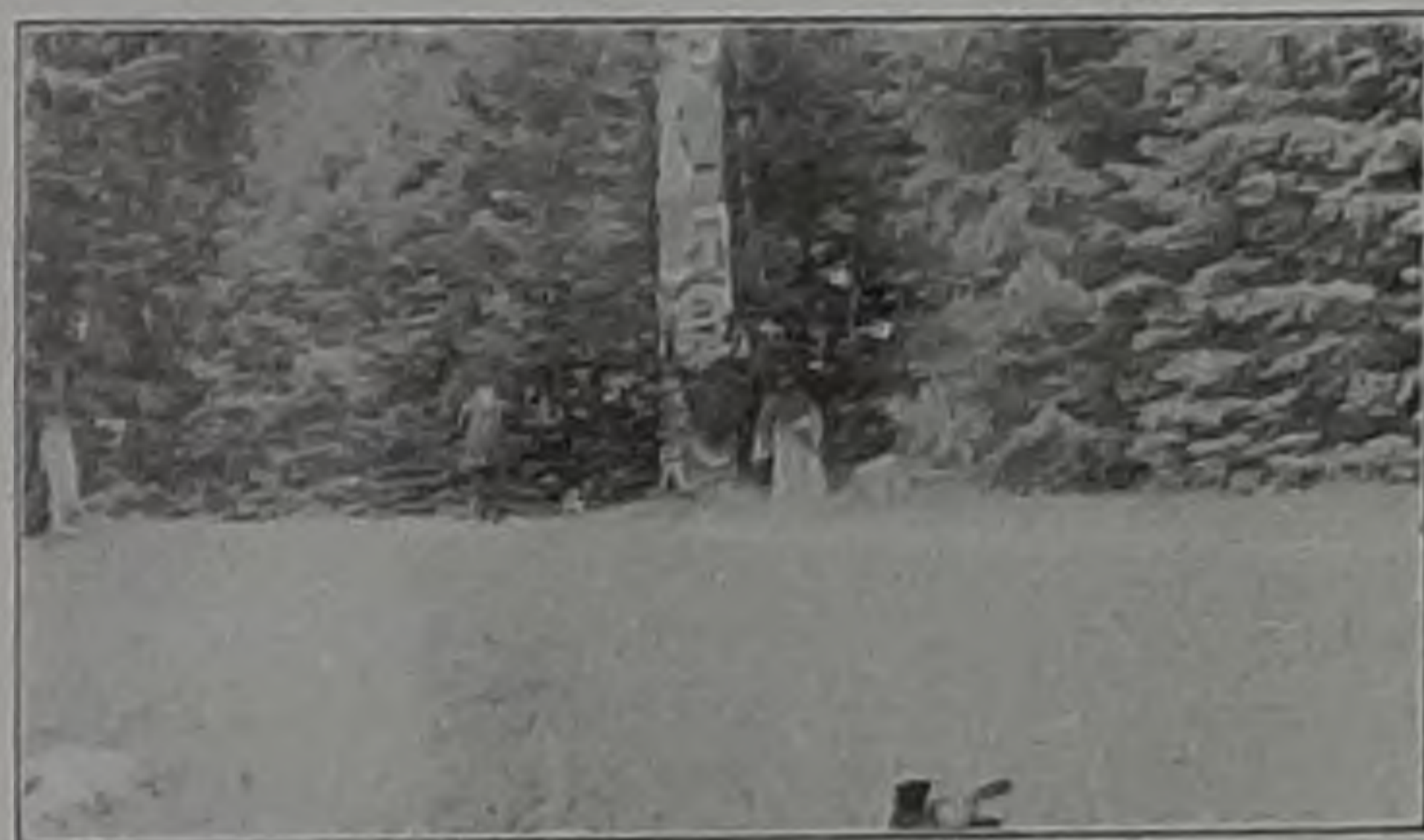
Въ Ситкинскомъ паркѣ у 60 футоваго Totem Pole.