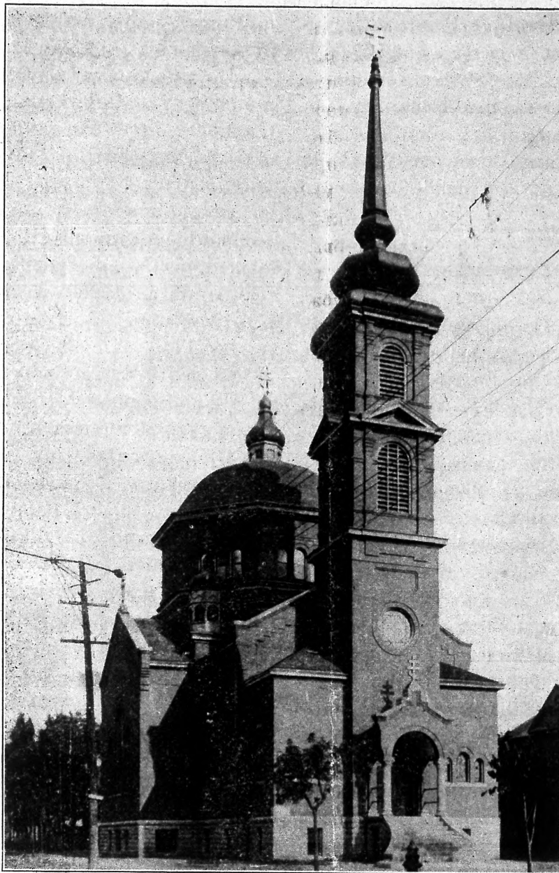
Русская православная церковь Св. Богородицы въ Миннеаполисѣ.

былъ прих. священникомъ, Высокопреосвященный въ другой разъ былъ въ Семинаріи, гдѣ былъ на урокахъ Свящ. Писанія (читалъ учитель В. Бензинъ), и на