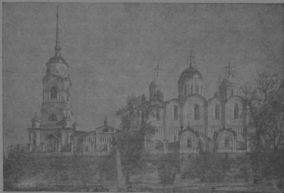
Скоропечатня И. Коиль. 1917 г.