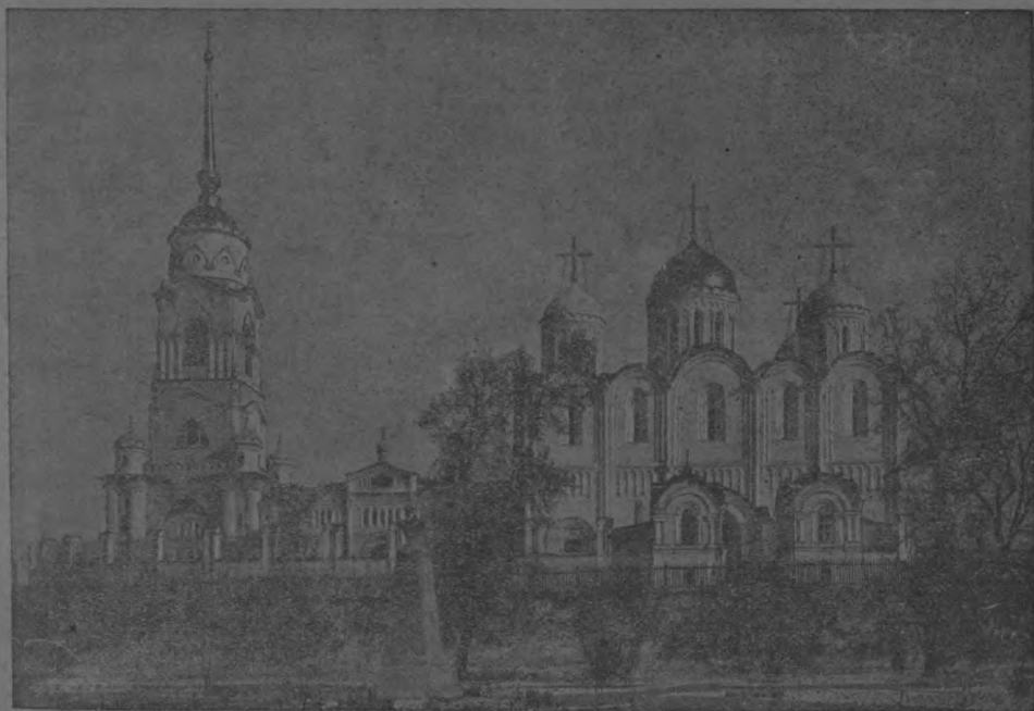
Скоропечатня И. Коиль. 1916 г.