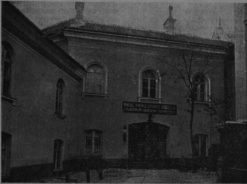
Фасадъ Виленскаго женскаго духовнаго училища.