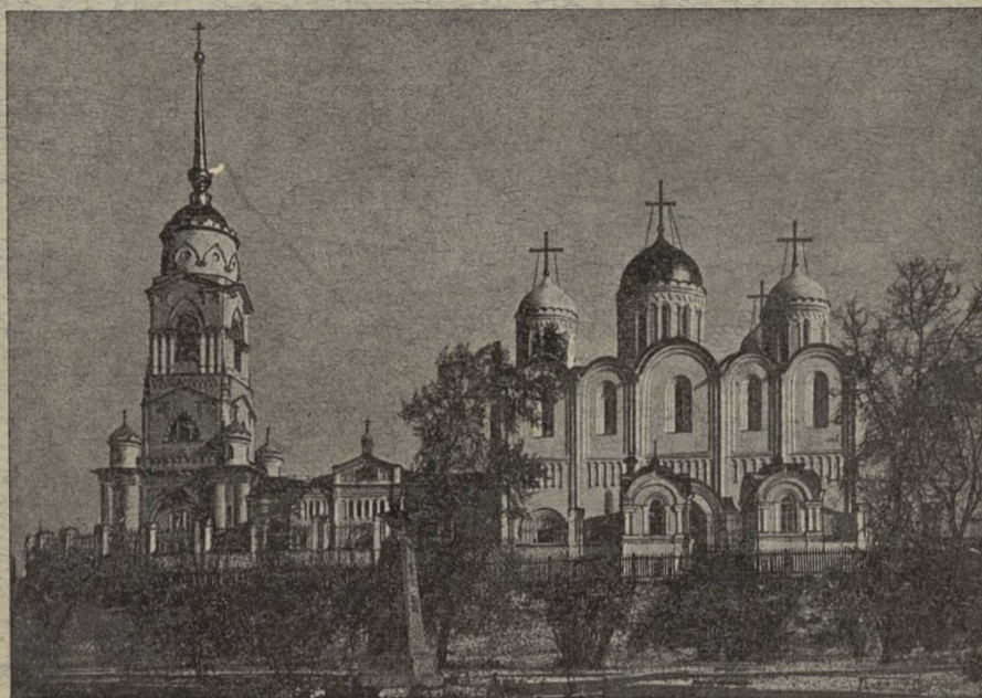
Губ. г. Владиміръ. СКОРОПЕЧАТНЯ И. КОИЛЬ.