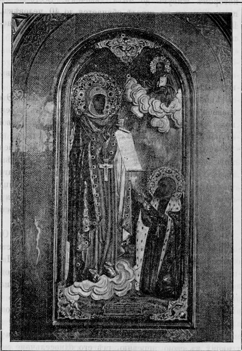
Боголюбская икона Божіей Матери въ Тишениновскомъ женскомъ монастырѣ.