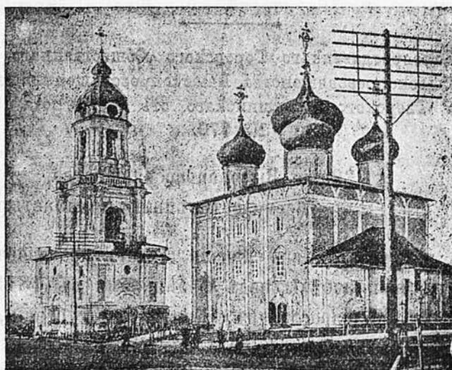
Тверской кафедральный соборъ.