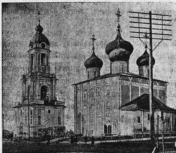
Тверской кафедральный соборъ.