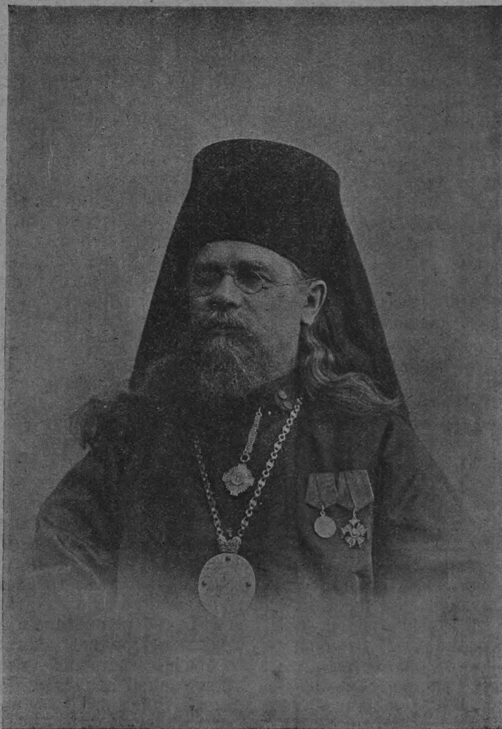
Преосвященнѣйшій Серафимъ, Епископъ Подольскій.